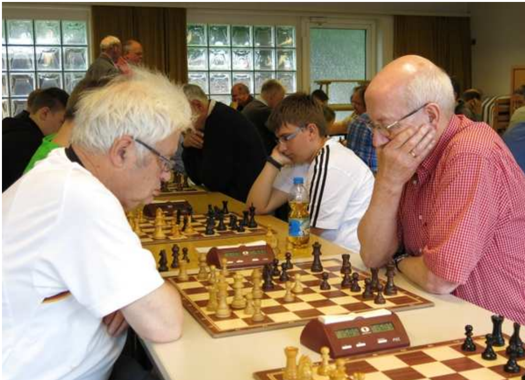
Müller gegen Müller