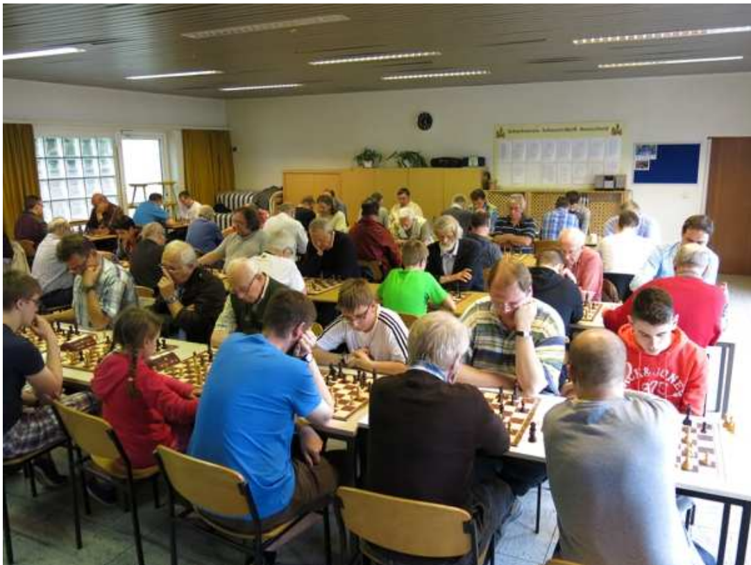
Blick in den Turniersaal