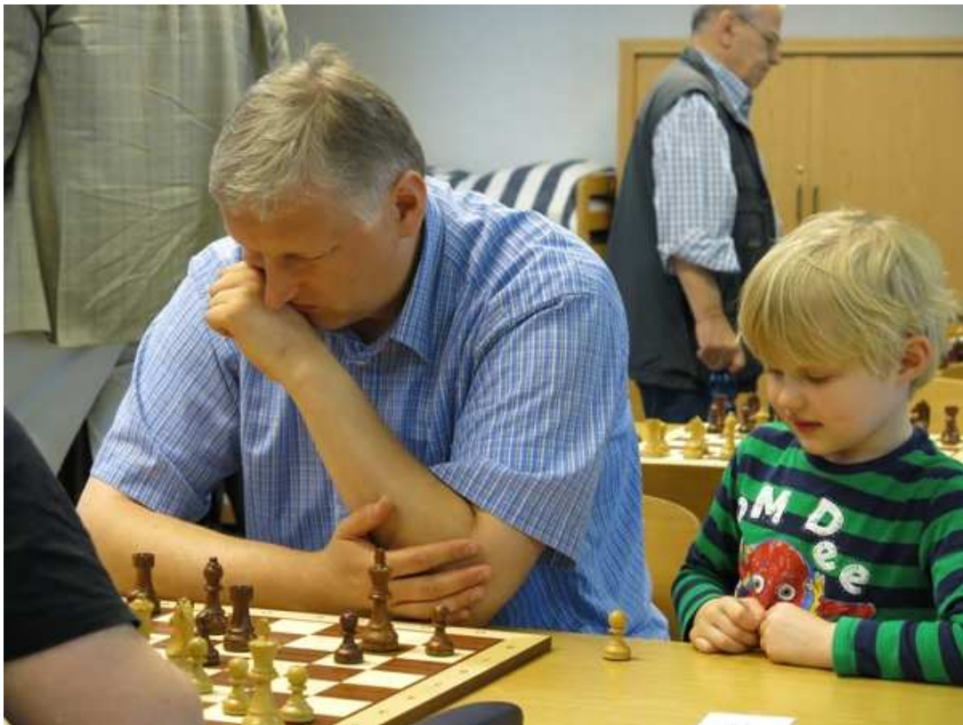
Papa hat einen Bauern gewonnen