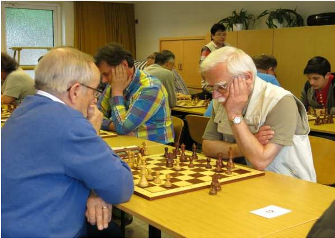
Nettesheim und Paradies